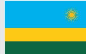
Bandeira da Ruanda