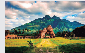
Parque Nacional dos Vulcões

Ruanda, na África Oriental, com cerca de 13 milhões de habitantes (2022), é majoritariamente cristã (cerca de 90%, incluindo católicos, protestantes e pentecostais), com a Igreja Presbiteriana em Ruanda sendo uma das maiores denominações reformadas, com mais de 1 milhão de membros. Apesar da liberdade religiosa formal, o governo impõe regulamentações rigorosas, resultando no fechamento de milhares de igrejas (cerca de 4 mil em anos recentes) por supostas falhas em normas de segurança e qualificação pastoral, afetando especialmente igrejas evangélicas e protestantes não tradicionais. Isso reflete paranoia ditatorial e protecionismo denominacional. Ore pela fidelidade das igrejas reformadas às Escrituras e confissões, capacitação de pastores, reabertura de templos e coragem para testemunhar em meio a controles estatais. Interceda por cura das feridas do genocídio de 1994 e reconciliação verdadeira em Cristo.