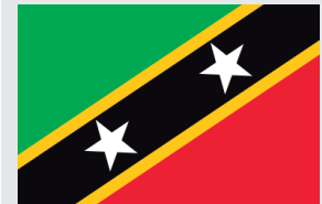
Bandeira de São Cristóvão e Névis

Você já fez a matrícula de seu filho, sobrinho ou neto no Simonton? Se você tem algum conhecido que tenha criança em idade de estudar no Simonton, divulgue nossa escola. Este ano temos novidades: Maternal e Berçário. Isso mesmo – do berçário até o 9º ano.