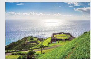
Fortaleza Brimstone Hill

São Cristóvão e Névis, nação insular caribenha com cerca de 47 mil habitantes, é predominantemente cristã (aproximadamente 93% da população, com evangélicos representando 22%), desfrutando plena liberdade religiosa sem perseguição significativa. A maioria pertence a denominações anglicanas, metodistas, católicas e pentecostais, com minorias reformadas presentes. Contudo, muitos praticam um cristianismo nominal, influenciado pelo secularismo, turismo intenso e desafios como desemprego e influência cultural externa. Ore para que o Senhor desperte reavivamento autêntico nas igrejas, fortaleça as comunidades fiéis às Escrituras, especialmente as de tradição reformada, conceda sabedoria aos pastores para discipular os fiéis contra o nominalismo e use os cristãos para evangelizar com ousadia, promovendo transformação espiritual e social.