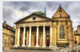
Catedral de São Pedro

A Suíça tem cerca de 8,7 milhões de habitantes e uma história inseparável da Reforma Protestante: foi em Zurique e Genebra que Zuínglio e Calvino pregaram, moldando igrejas reformadas em todo o mundo. Dados de 2024 mostram que 31% dos suíços se identificam como católicos romanos e 19% como membros da Igreja Evangélica Reformada — herdeira direta de Calvino, mas hoje Igreja estatal, com apenas 25% de praticantes regulares. Os cristãos de igrejas livres (batistas, pentecostais, anabatistas e outras) somam 6% da população e desafiam a maré secular: cerca de 30% frequentam o culto semanalmente e 45% leem regularmente literatura religiosa — os maiores índices do país. Mais de 32% dos suíços não têm filiação religiosa. Ore para que o Senhor avive Sua igreja na terra de Calvino, concedendo coragem para pregar o evangelho genuíno e conversões em meio à crescente secularização.