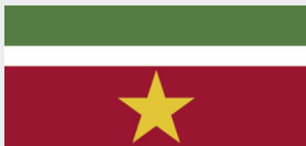
Bandeira do Suriname

Fontes: Fundação Pontifícia ACN; Portal Luteranos; Teologia Brasileira